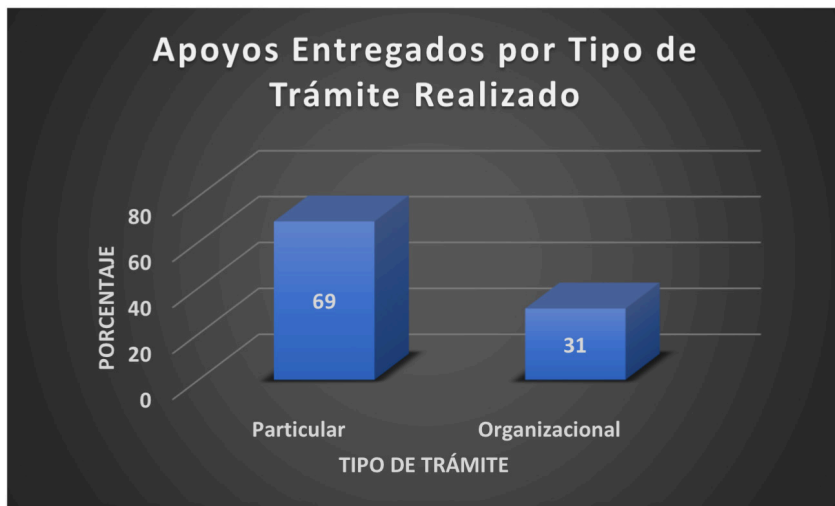
Figura 1. Apoyos Entregados por Tipo de Trámite Realizado