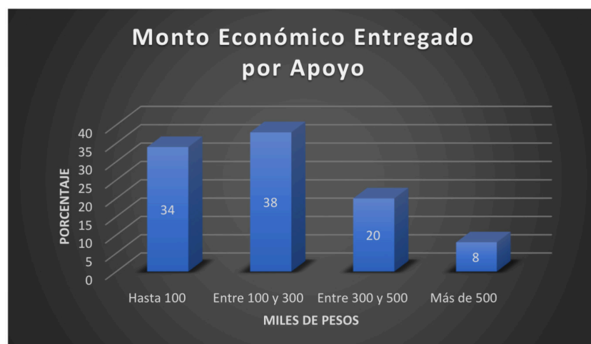
Figura 4. Monto Económico Entregado por Apoyo