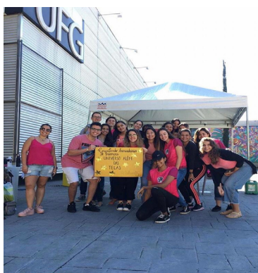
Figura 2: Participantes no Curta o Campus da Universidade Federal de Goiás.