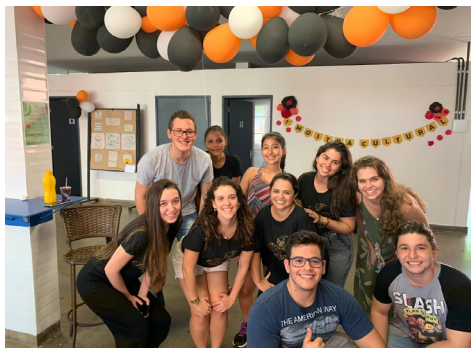
Figura 1: Participantes na 1ª mostra cultural na Faculdade de Nutrição da Universidade Federal de Goiás.