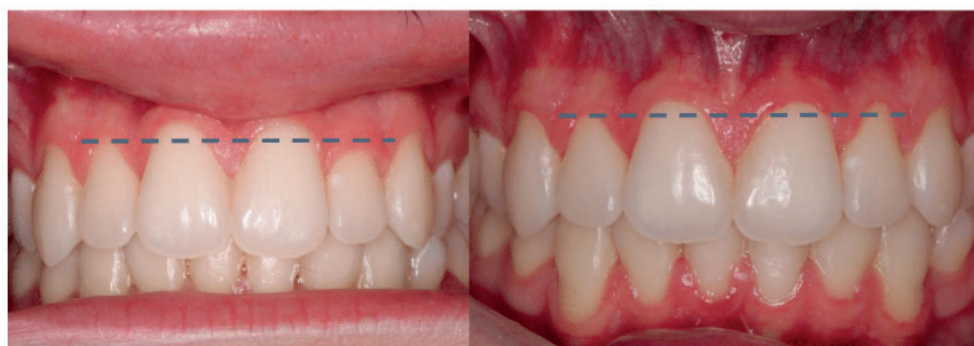
FIGURA 4: Comparação inicial e do pós-operatório.