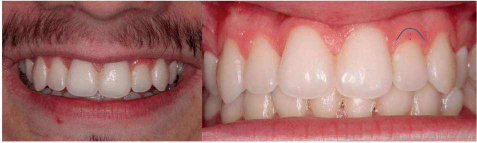
FIGURA 1: Fotos iniciais do paciente.