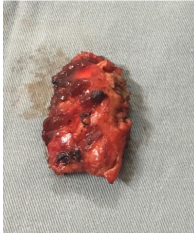
Figura 2: Peça tumoral ressecada