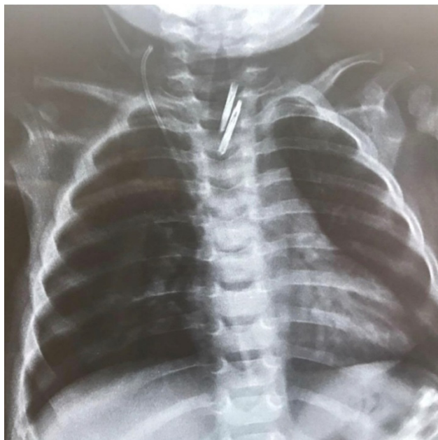
Figura 3 – Radiografia de pescoço e tórax com visualização dos endoclipes.