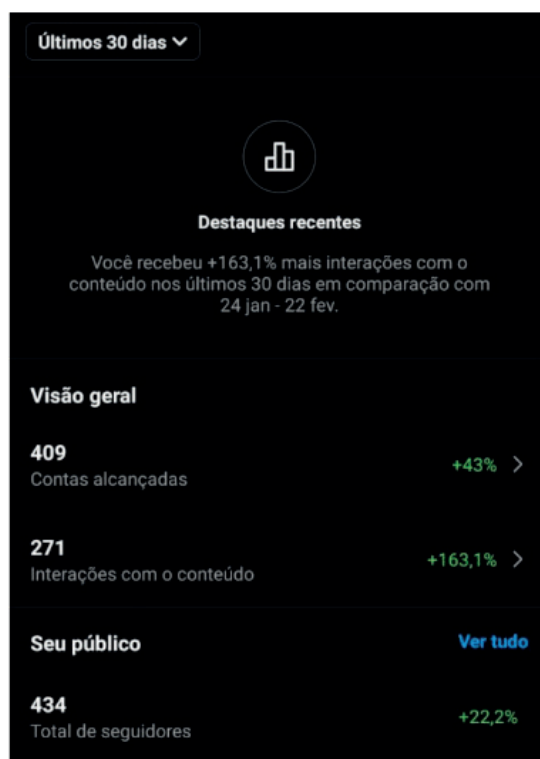
Figura 4 – Alcance e engajamento – Instagram