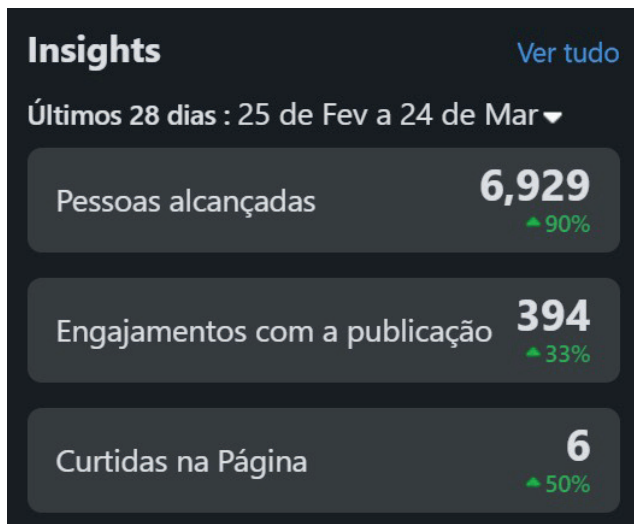
Figura 3 – Alcance e engajamento – Facebook