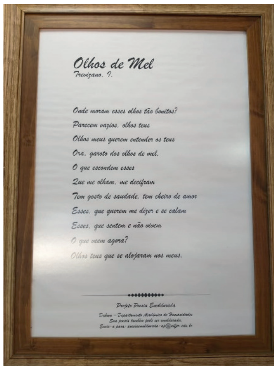
Figura 1– Poema “Olhos de Mel”, de I. Trevizano