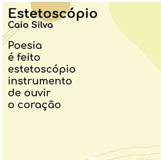
Figura 2 – Poema “Estetoscópio”, de Caio Silva