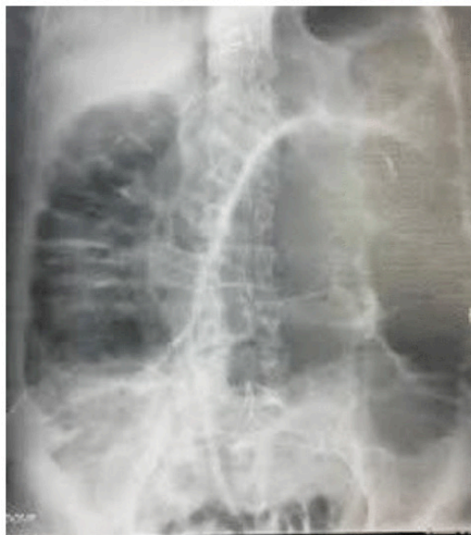
Figura 1: Radiografia de abdome com evidência do sinal do "grão de café" sugestivo de volvulo do sigmóide.

Paciente encaminhada ao centro cirúrgico para realização de laparotomia exploradora, a qual revelou distensão das alças intestinais ao nível do cólon sigmóide, em que estava torcido sobre seu próprio eixo. Mediante elevada taxa de leucocitose e o nível de hipoalbuminemia, bem como instabilidade hemodinâmica, foi realizado sigmoidectomia via Hartman com posterior programação de anastomose primária do trato digestivo.