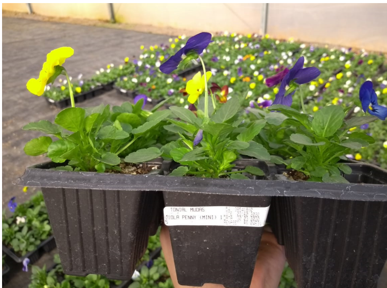
Figura 3: Bandeja com 15 unidades de Viola Penny