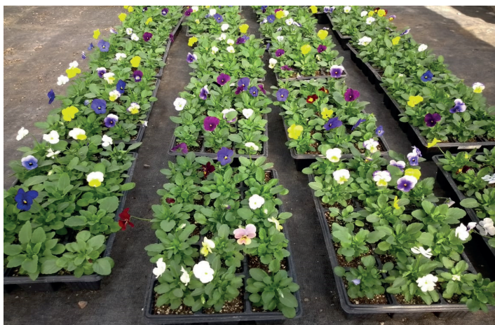
Imagem 2: Estoque de Viola Penny

O presente artigo teve como objetivo principal a elaboração de um plano orçamentário de um produto ou serviço, produzido ou prestado por uma empresa da escolha dos envolvidos. Neste caso, o produto escolhido foi: muda de Viola Penny (Mini Amor Perfeito) produzida por um viveiro atuante na região. Tal produto pode ser observado nas imagens 2 e 3.