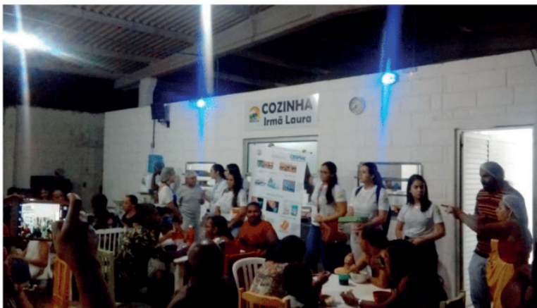
Figura 2: Extensionistas realizando palestra explicativa para os membros da comunidade.

modelos, os mesmos ensinaram ao público presente sobre o uso adequado e como higienizar a prótese, câncer de boca e seus fatores de risco. Logo após as palestras, os pacientes que tinham interesse se dirigiam a um membro da extensão, onde eram coletados alguns dados como nome, idade e telefone, e em seguida era realizada a marcação da consulta (figura 2).