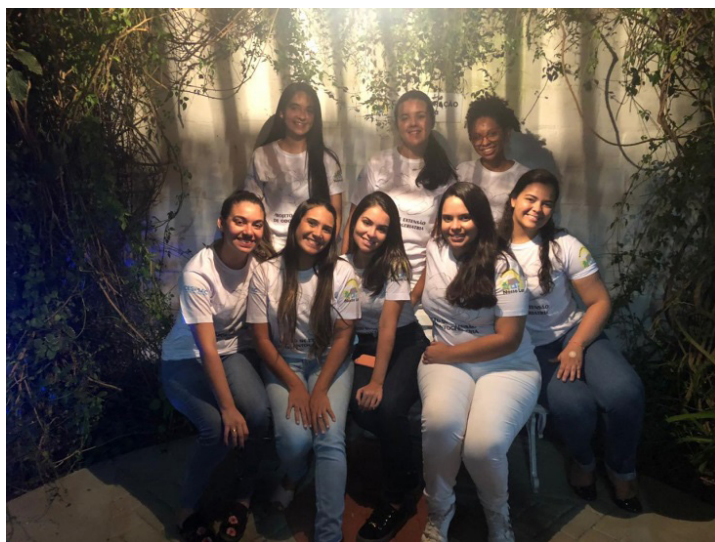
Figura 1: Membros da extensão no primeiro encontro.

Atualmente, a extensão é formada por oito discentes do curso de Odontologia do Centro Univesitário CESMAC e supervisionada por dois docentes da mesma instituição. Suas atividades são desenvolvidas quinzenalmente, uma vez por semana, em um período extracurricular, não comprometendo o funcionamento da grade curricular básica da instituição (Figura 1).