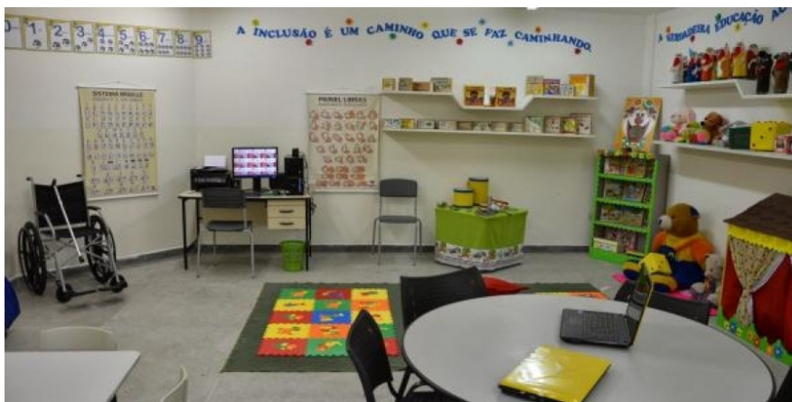
Figura 2- Imagem ilustrativa tirada da internet de uma Sala de Recursos Multifuncionais