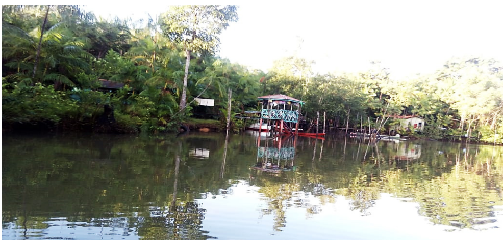
Figura 1. Foto de algumas residências às margens do rio Caratateua, que banha a Comunidade São Pedro, localizada na ilha do Capim.

A pesquisa tem uma abordagem qualitativa e optou-se pelo estudo de caso (BECKER, 1994). A coleta de dados ocorreu em dezembro de 2018 na comunidade São Pedro, que é banhada pelo rio Caratateua (Figura 1), localizada na Ilha do Capim (composta por 95 ilhas) no município de Abaetetuba/PA.