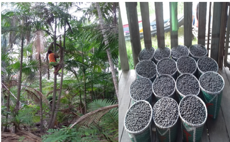
Figura 3. Coleta do açaí e seu acondicionamento em cestos para a comercialização.

O extrativismo de açaí (Figura 3) é uma atividade muito praticada no município de Abaetetuba, as suas árvores são muito comuns nas várzeas da região das ilhas. Representando uma grande parcela da economia local. Após a coleta nos açazeiros o fruto é acondicionado em paneiros e comercializado na feira de Abaetetuba e também no mercado do Ver-o-Peso na capital paraense.