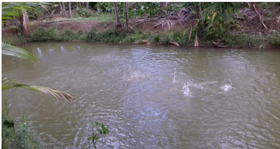
Figura 2. Tanque para criação de tambaqui.

Essa atividade foi identificada em uma família como forma de complementar a renda e fonte de alimentação, sendo ainda recente. A criação de tambaqui é realizada em um tanque (Figura 2) adaptado com tubulações que utilizam a água do rio Caratateua.