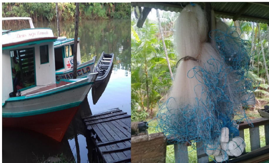
Figura 4. Embarcações e rede de pesca de famílias da Comunidade São Pedro.

Essa atividade é bastante expressiva no município de Abaetetuba, sendo praticada ao longo do ano todo, sobretudo nas comunidades das Ilhas. Os principais instrumentos utilizados pelos pescadores são as redes com malhadeiras e os barcos e canoas são utilizados para a pesca e para o transporte no rio (Figura 4).