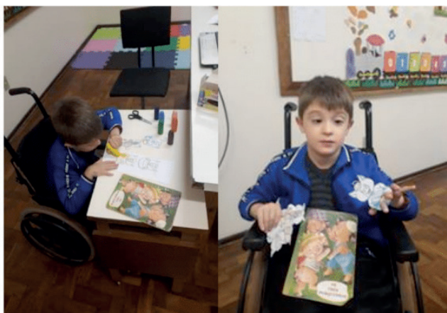
Figura 2: Aluno realizando a prática

2º momento: Fizemos a distribuição dos personagens da história, onde, manuseamos e brincamos livremente com as peças dos personagens de dedoche de papel. Após, colorimos os três porquinhos e o lobo mau com giz de cera. Oportunizando a ele observar que há dois tipos de animais: porco e lobo. Também distinguiu a variedade de materiais das casas na história: palha, madeira e tijolos.