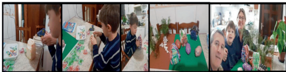
Figura 3: Aluno realizando a prática construção da maquete.

4º momento: Lançamos o desafio para a família no sentido, de concluir a maquete com isopor da história, contendo somente doces. A casa de palha necessitava ser com papeis de balas, a casa de madeira com pirulitos e casinha de tijolos (já realizada) com Bis .