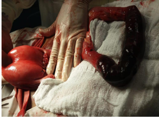
Figura 2 - Segmento comprometido

Diante dos achados de menor gravidade foram realizadas as devidas correções. O útero passou por limpeza manual, utilizando-se compressas em seu interior e correção cirúrgica com sutura por meio da técnica de chuleio ancorado com Cat Gut simples. (Figura 3).