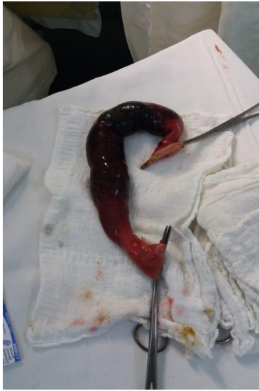
Figura 4- Segmento de intestino delgado ressecado.