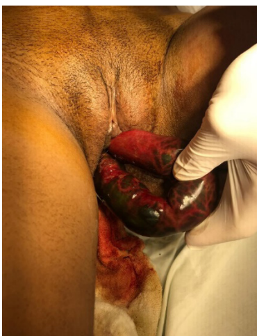
Figura 1- Evisceração por via vaginal com isquemia de alças intestinais.

Após 3 dias do procedimento evoluiu com evisceração de alças de intestino delgado por via transvaginal ( figura 1 ). Sendo referenciada, então, para serviço de cirurgia geral na cidade de Floriano-PI.