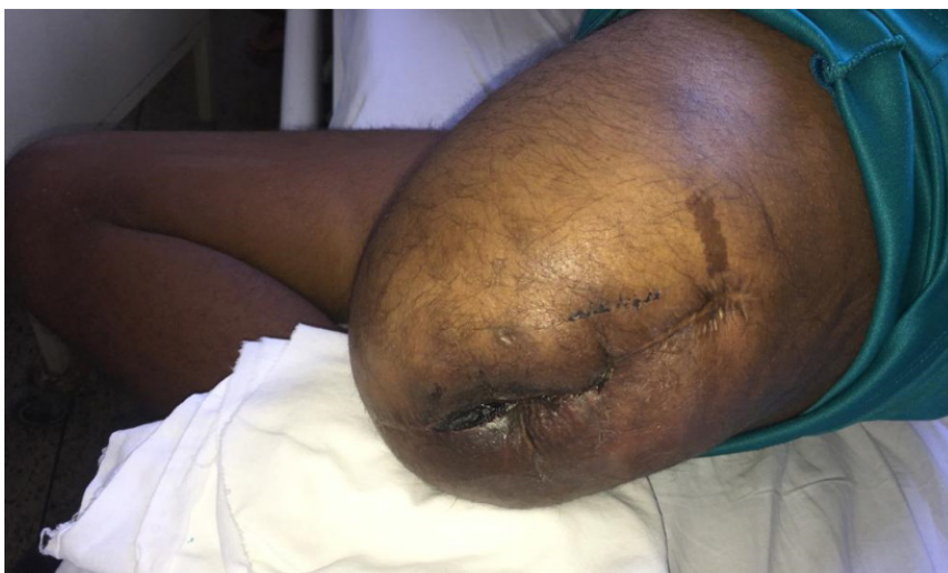
Figura 1: Membro esquerdo hipertrofiado com cicatriz de amputação prévia e membro direito sem malformações.

Além disso, foram realizadas embolizações na tentativa de diminuir a quantidade de fístulas e suas complicações sistêmicas, o que não resultou em melhora do quadro clínico.