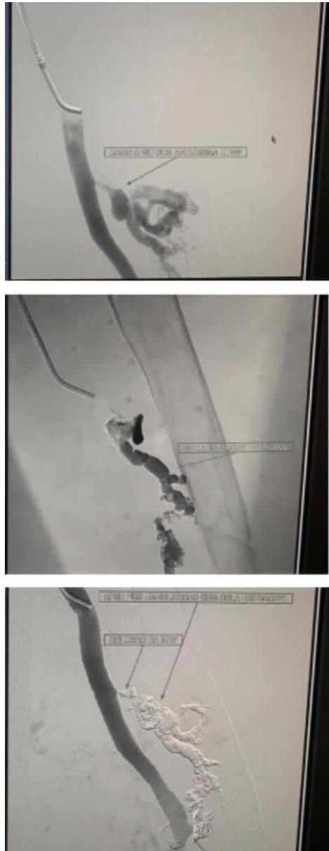
Figura 3: 3.1Pré-embolização com Glubran e Lipiodol (ramo da artéria femoral superior; a esquerda com FAV e aneurisma)