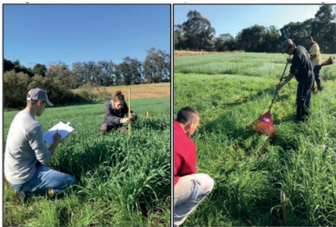
Figura 1. Avaliação da estatura das plantas e Realização do corte único.