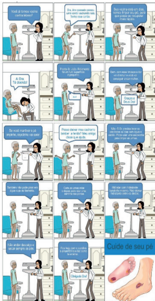
Figura 2 – Fluxo do atendimento no serviço de saúde de uma pessoa em situação de rua com lesão no pé.