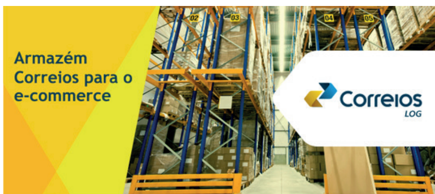
Figura 3. Armazém dos Correios

Os Correios demonstram importantes avanços, com foco na recuperação e manutenção da saúde financeira da empresa. Atualmente, a estatal opera com receita positiva e se posiciona como uma empresa dinâmica e adaptável às novas realidades e tendências do mercado. Neste período de pandemia, os Correios têm se mostrado ainda mais relevantes, cumprindo sua missão de entregar as melhores soluções à população também nesse momento adverso, em que segue prestando seus serviços essenciais em todo o território brasileiro.