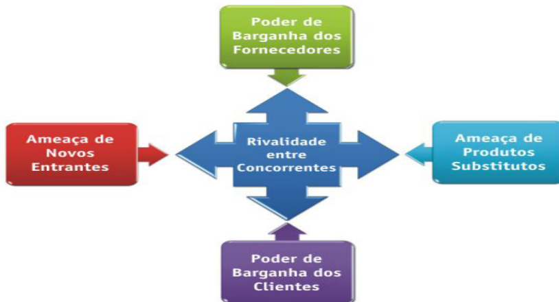
Figura 1: As cinco forças competitivas de Porter