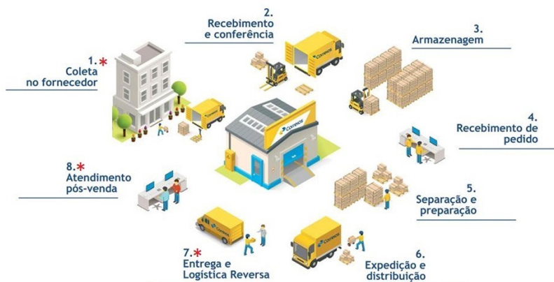
Figura 2. Logística Integrada