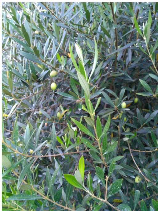
Fig. 1: Oliveira na Serra da Mantiqueira

oliveiras que se adaptaram (Gonçalves et al., 2020), produzem olivas sazonalmente (Modolo, 2007) por isso, o azeite de oliva tem alto custo comercial. Por consequência, as tentativas de adulteração deste produto com outros tipos de azeites mais baratos, como o azeite de oliva refinado, por exemplo, é comum. Este trabalho visa despertar um maior interesse dos órgãos de vigilância e de controle de qualidade de azeites de oliva, mostrando a importância da aplicação de metodologias específicas para evidenciar adulterações deste produto. Este estudo propôs a quantificação de estigmastadienos como a principal técnica capaz de identificar fraudes em azeites de oliva extra virgem e virgem. Este método analítico consiste na saponificação da amostra de azeite na presença de padrão interno (colesta-3,5-dieno, e estes frutos são utilizados na elaboração de azeites, a Fig. 1 apresenta uma oliveira com frutos plantada na Serra da Mantiqueira.