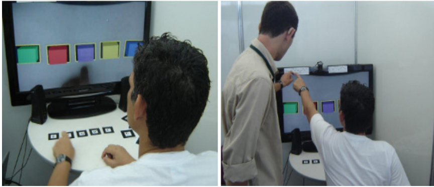
Figura 1. Indivíduo na atividade com o software GV executando a sequência de notas musicais.

O envelhecimento populacional é um desafio para a nossa década e com a expectativa de vida ultrapassando os 80 anos. A Organização Mundial de Saúde (OMS) estabelece princípios para promoção da saúde do idoso que devem ter seus reflexos na qualidade de vida no envelhecimento. Estes princípios transitam no conceito holístico, intersectorialidade, empoderamento, na participação social, na equidade, nas ações multiestratégicas e na sustentabilidade (Pimenta, 2017). Nem todos estes princípios estão contemplados para o idoso na promoção da sua saúde.