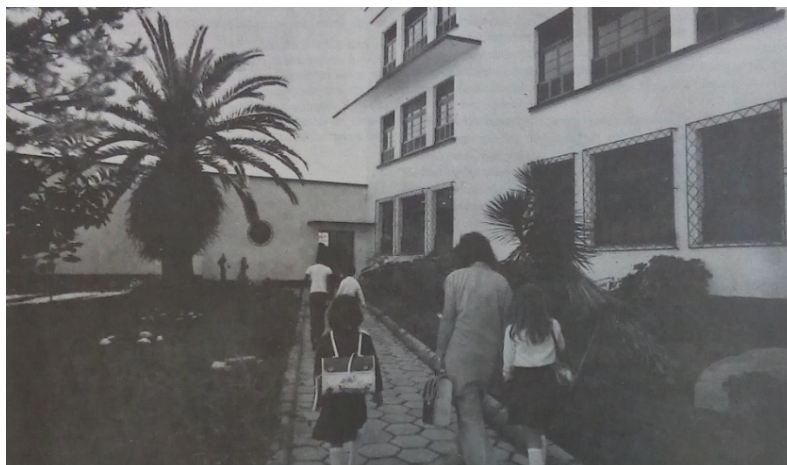
Figura 2 – Instituto de Educação Assis Brasil, volumetria lateral antes da reforma.

Na década de 1980, com intuito de melhorar as instalações e o fluxo de acesso à escola para os estudantes, o prédio original passou por uma ampliação, a qual alterou parte da sua volumetria lateral. A obra contou com a construção de um volume de dois pavimentos com quatorze salas de aula, lanchonete, saguões e novos espaços para recreação. Na figura 2, podemos visualizar a volumetria original da escola, enquanto a figura 3 mostra a fachada lateral após a ampliação, onde atualmente encontram-se salas de aula para o ensino fundamental. A reforma, que ocorreu há mais de 30 anos marca um momento importante que representa o desenvolvimento da instituição e perante as instruções da Carta de Restauro de 6 de abril de 1972, anexo B, devem ser respeitados todos os elementos acrescentados e evitadas as intervenções de renovação ou reconstituição.