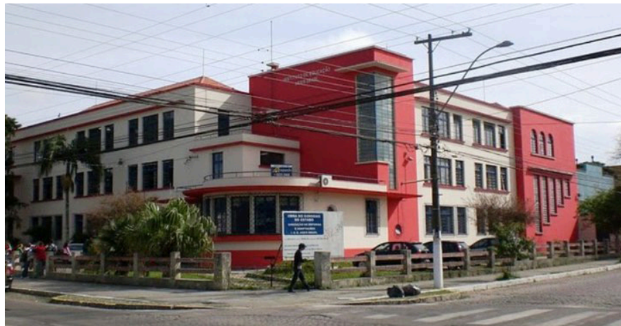
Figura 1– Instituto de Educação Assis Brasil