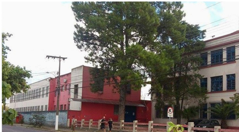
Figura 3 – Instituto de Educação Assis Brasil, volumetria lateral depois da reforma.