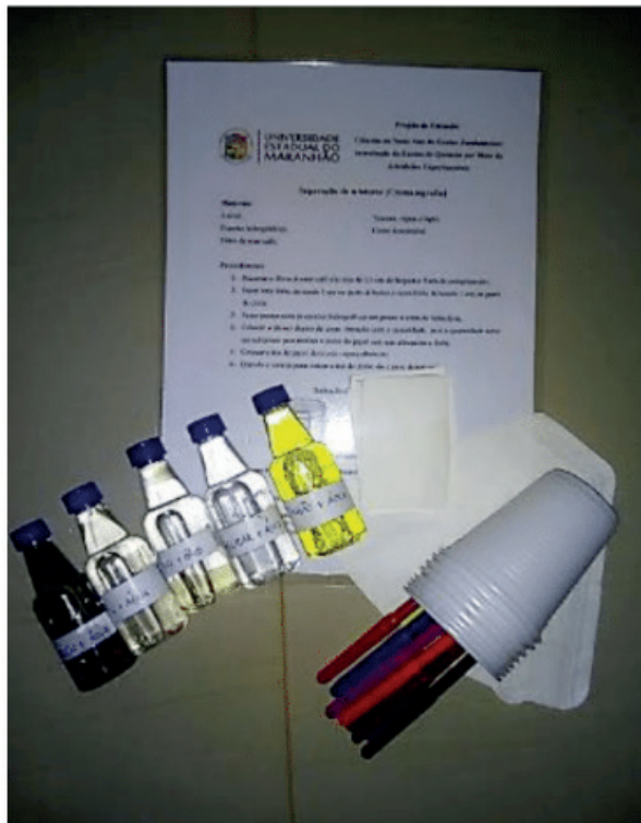
Figura 2: Kit de cromatografia simples