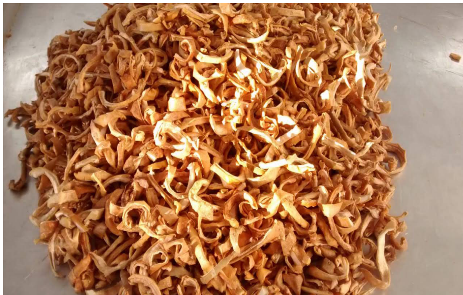
Figura 2 – Casca de maracujá depois da etapa de secagem

Após a obtenção da farinha, foram acondicionadas em embalagens de polietileno próprias para serem seladas em seladoras de pedal e armazenadas até o momento da utilização.