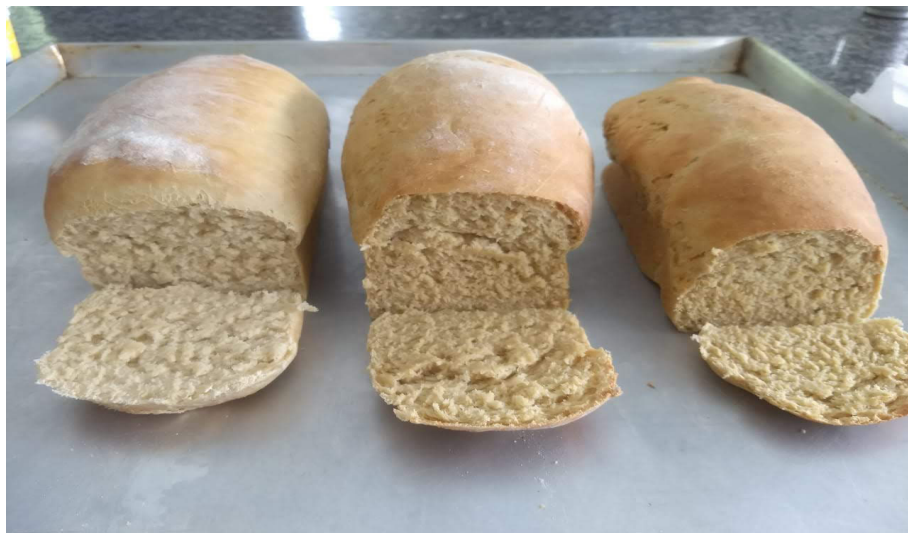
Figura 3 – Pães com formulação Padrão, com substituição, 10% e 15% de farinha de maracujá

com substituição de 15% da farinha de trigo pela farinha de maracujá, apresentou a massa clara, porém sua aparência era de pão integral e o sabor não ficou com residual amargo tão forte. O pão elaborado com 10% foi o que mais se assemelhou a formulação padrão, o melhor crescimento e o sabor não apresentou amargor.