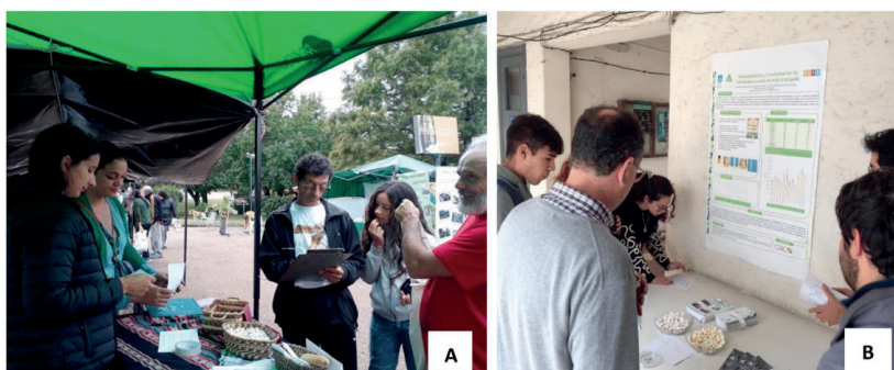
Figura 9.2. A: «Desafío del sabor» durante VIII Fiesta Nacional de la Semilla Criolla y Agricultura Familiar. B: Caracterización gastronómica «Desafío del sabor» en la Jornada de Puertas Abiertas 2019 en la Facultad de Agronomía.

Se realizaron 129 entrevistas en tres eventos diferentes: VIII Fiesta Nacional de la Semilla Criolla y Agricultura Familiar, en el Departamento de Salto; I Muestra Nacional de Agroecología, realizada en Canelones, y en la Jornada de Puertas Abiertas, en la Facultad de Agronomía, Montevideo. Las diferencias en los resultados de las evaluaciones de capacidad de expansión y sensorial se evaluaron con un análisis de varianza y una prueba de Chi-cuadrado. Los datos se analizaron utilizando el software PAST (Hammer y otros, 2001).