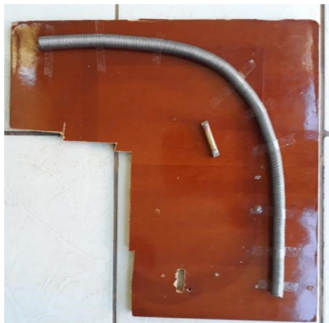
Figura 1 - Montagem do trem magnético.