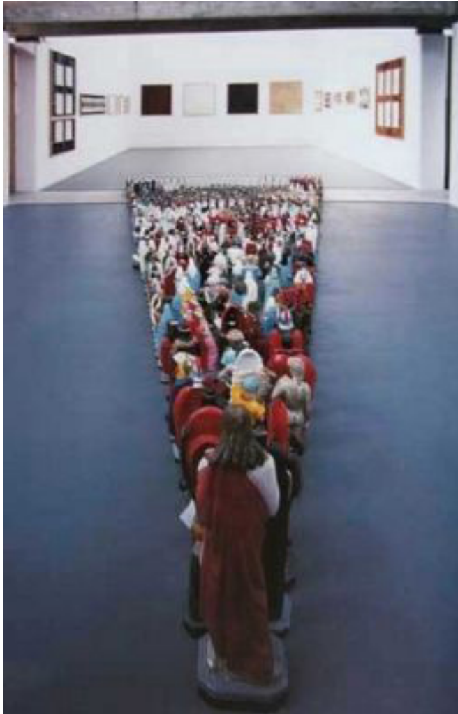
Figura 2. Nelson Leirner. A Grande Parada, 1999.

Em A Grande Parada , o conjunto de imagens apropriadas e acumuladas sintetiza a plataforma criativa de Nelson Leirner: a mistura estética, bem brasileira, em seus contornos multiculturais e em concepção artística multidimensional.