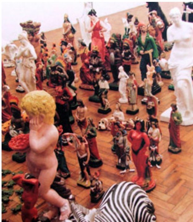
Figura 4. Nelson Leirner e o processo de Acumulação.

Somatória de objetos diversos na constituição de obras de arte.