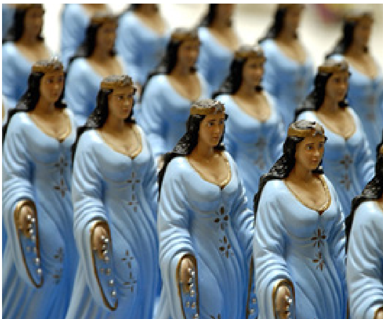
Figura 3. Nelson Leirner e o Processo de Acumulação de Imagens Prontas.

Incorporação de objetos extra-artísticos e de referências imagéticas nos trabalhos de arte.