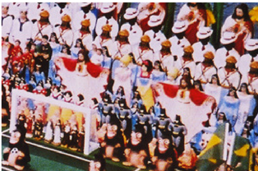
Figura 5. Nelson Leirner Arte Contemporânea Multicultural e Multidimensional.

Ou seja: a linguagem de uma obra de arte contemporânea é o resultado da expressão-comunicação visual instituída pelo artista, por força pessoal e criativa. Transformando o contexto com o qual se confronta e utiliza. É, então, na intensidade inventiva da linguagem que se mede a intensidade criativa (Crispolti, 2004: 63).