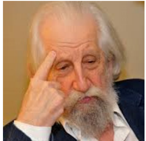
Figura 1. O artista Nelson Leirner.

O artista brasileiro Nelson Leirner nascido em 1932, em São Paulo, ao longo de sua trajetória artística investiu em excêntricas formas de expressão, apresentando objetos que configuraram um complexo sistema de apropriação e acumulação signíca – método criativo que iria marcar sua identidade produtiva. Integrou, com Wesley Duke Lee, Carlos Fajardo