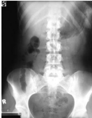
Figura 2 Radiografia de abdome em decúbito dorsal.