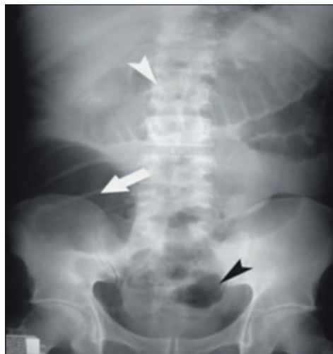
Figura 1 Radiografia de abdome em anteroposterior, decúbito dorsal.