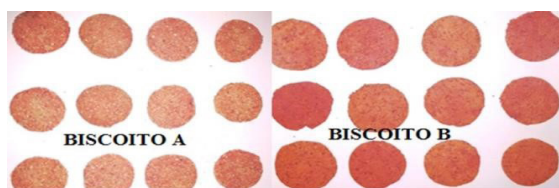
Figura 2 – Biscoitos A e B respectivamente após forneamento.

O aspecto visual dos biscoitos elaborados é apresentado na Figura 2. A adição da farinha de beterraba forneceu uma coloração avermelhada aos biscoitos elaborados, resultado dos pigmentos encontrados na farinha da hortaliça.