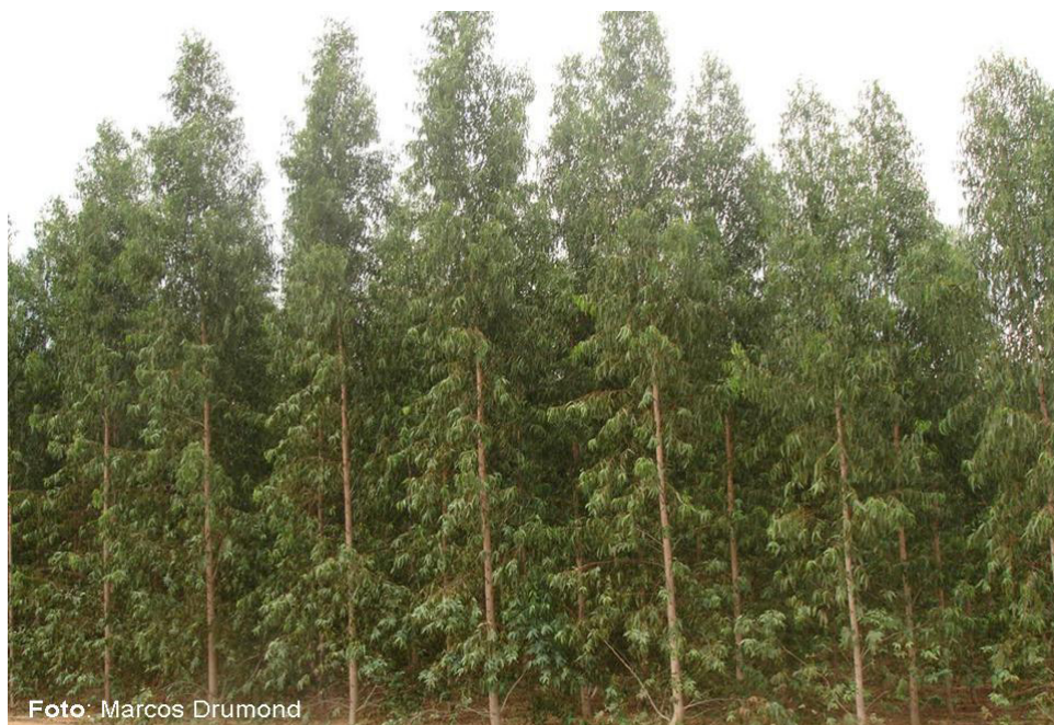
Figura 1. Híbrido de Eucalyptus brassiana x E. urophylla aos 36 meses e idade.

Na Figura 1, pode-se observar desenvolvimento do híbrido de Eucalyptus brassiana x E. urophylla aos 36 meses de idade, na Chapada do Araripe, em Araripina-PE.