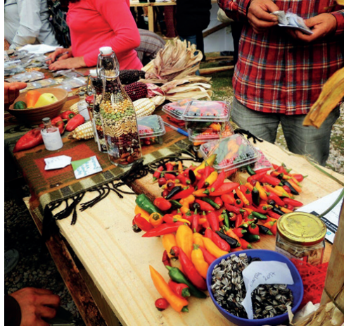
Figura 7.2. Intercâmbio de sementes realizado durante a 7ª Festa da Semente Crioula e a Agricultura Familiar, realizada em abril de 2017, em La Paloma, Rocha, Uruguai.

A prática do intercâmbio também alimenta as relações entre vizinhos e vizinhos e o tecido social, tanto comunitário, como regional e nacional. É por isso que, para a Rede, é tão importante a organização de diversas formas de reuniões ao longo do ano, reuniões de grupo, reuniões de líderes de grupo em nível nacional, reuniões regionais; e a cada dois anos uma reunião nacional com todos os membros. Essas reuniões são sempre acompanhadas por uma festa ou celebração onde ocorre o intercâmbio de sementes e conhecimentos.