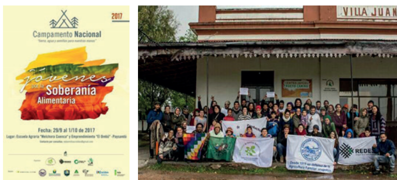
Figura 7.3. Pôster do II Acampamento Nacional de Jovens pela Soberania Alimentar e foto do final do acampamento.

Em setembro de 2017, foi realizado o II Acampamento Nacional de Jovens para a Soberania Alimentar “Terra, água e sementes para as nossas mãos”, no departamento de Paysandú, em uma área próxima à exploração de combustíveis fósseis (Figura 7.3). O programa incluiu como um dos eixos centrais o problema da mineração e do fracking , para contribuir com a conscientização e o debate entre os e as jovens sobre os impactos dessas atividades no meio ambiente e nos territórios. Foi também realizado trabalho sobre os direitos fundamentais - como o direito à água, à soberania alimentar, à terra e ao território - para contribuir com a formação política daqueles que sucederão os atuais líderes das organizações territoriais mais importantes do Uruguai.