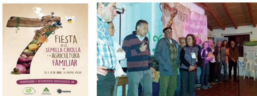
Figura 7.1. Poster e atividades da 7ª Festa da Semente Crioula e a Agricultura Familiar, realizada em abril de 2017, em La Paloma, Rocha, Uruguai.

regularmente para planejar a produção e trocar sementes, além de discutir e planejar ações relacionadas às suas necessidades ou interesses particulares. A cada dois anos é realizado um Encontro Nacional e uma Festa de Semente Crioula (Figura 7.1), onde se avalia o que foi realizado e são definidas as linhas de trabalho estratégico até o próximo ano. É nesta instância da assembleia que são definidas as diretrizes políticas da Rede. Cada grupo local nomeia dois referentes (mulher e homem) para participar das Reuniões de Referentes realizadas durante o ano, onde ocorre a continuidade e acompanhamento das definições do Encontro Nacional.