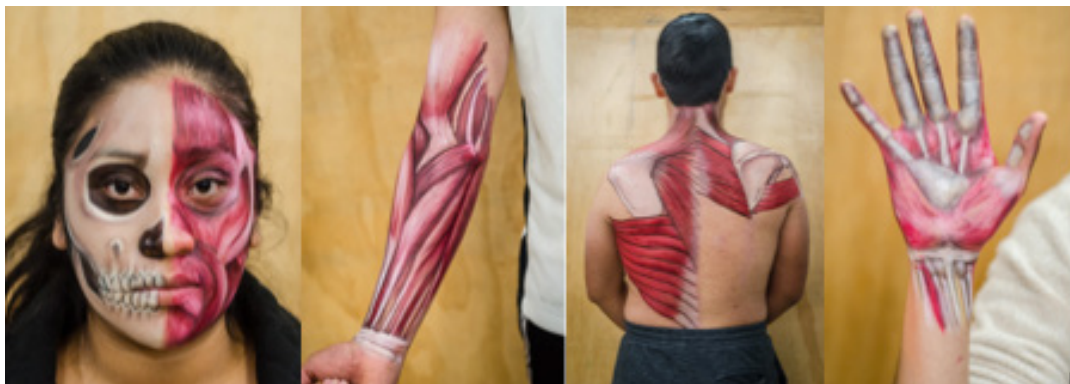
Fig. 1: Algunos de los trabajos de la pintura corporal terminados.

Resultados: Los estudiantes percibieron la promoción de la pintura corporal como estrategia de aprendizaje de excelencia (53.3%), la eficacia de la pintura corporal como excelente (73.3%), valorando el trabajo colaborativo entre pares con una apreciación excelente (46.7%) y considerando que la retención y recuerdo del conocimiento ha sido muy buena (40%), en tanto que experiencia redundó en una actitud de excelencia (60%), manifestando una apreciación ética-moral del cuerpo humano excelente (86.7%). Cabe destacar que las estructuras anatómicas dibujadas sobre la piel como los músculos, al momento de la contracción y elongación, fueron observables al movimiento. Conclusiones: Los resultados generales, avalan los beneficios del aprendizaje de la pintura corporal, sugiriendo una investigación adicional. Lo que es respaldado por investigaciones anteriores que demuestran que los anatomistas aprecian la pintura corporal como un complemento eficaz, económico y atractivo para el currículo de anatomía interdisciplinaria.