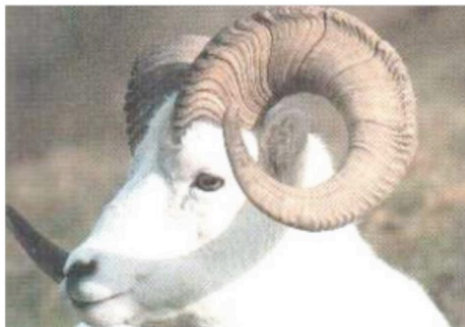
Figura 4 - Antílope com chifre em forma de espiral