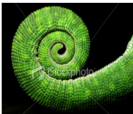
Figura 5 - Camaleão com rabo em forma de espiral

Outro animal é o camaleão que ao contrair seu rabo forma uma das espirais mais perfeitas.