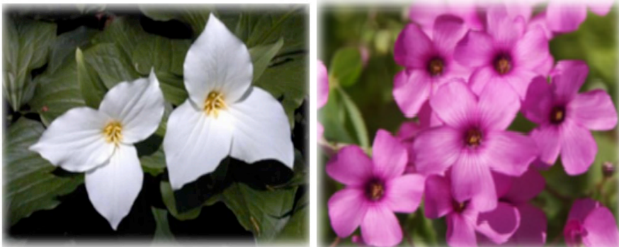
Figuras 3 – Flores com 3 e 5 pétalas

É possível observar essa sequência em copas das árvores ou até mesmo no número de pétalas das flores. Um exemplo são as imagens da Figura 3 que possuem 3 e 5 pétalas, respectivamente, outras possuem 13 pétalas, assim representam a sucessão de Fibonacci.