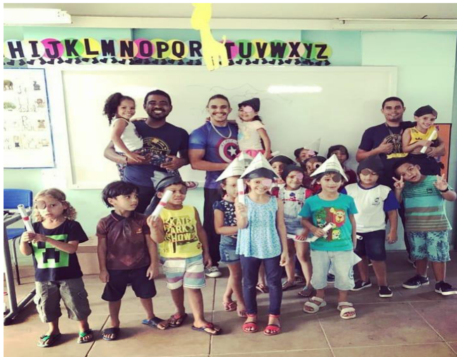
(culminância estagio supervisionado 1)