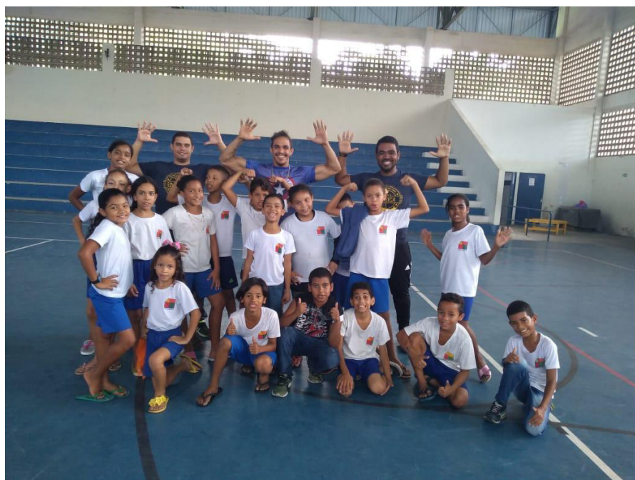
(foto arquivo pessoal do grupo, Lar São Domingos, estagio supervisionado 2)