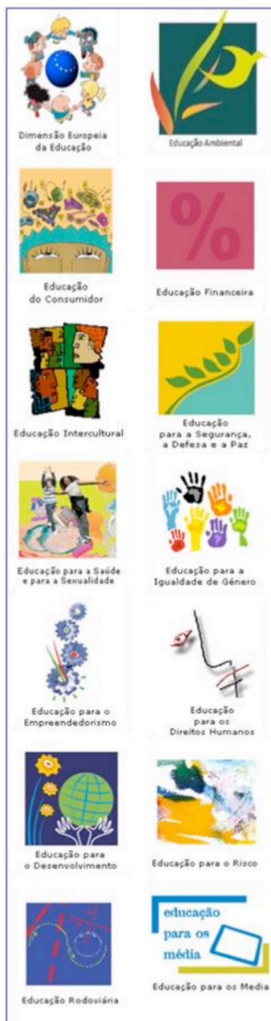
Figura 1 - Áreas temáticas previstas no currículo de Desenvolvimento e Cidadania Global