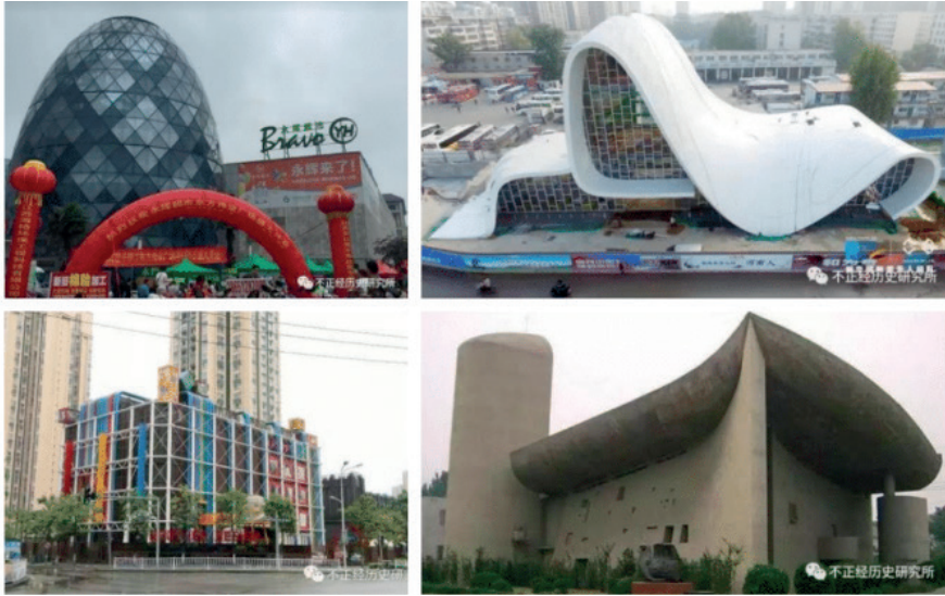
Figura 4. Algumas das cópias arquitetônicas chinesas