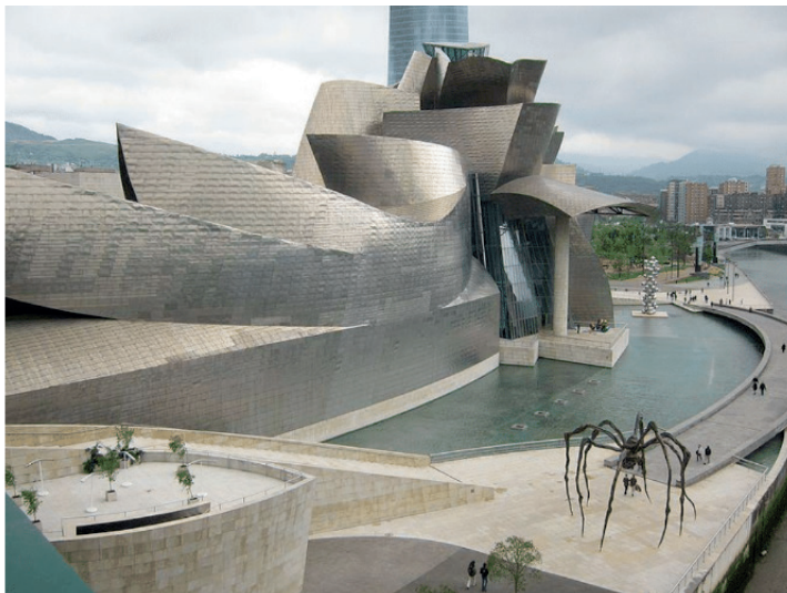
Figura 3. Museu de Bilbao (1997) de Frank Gehry