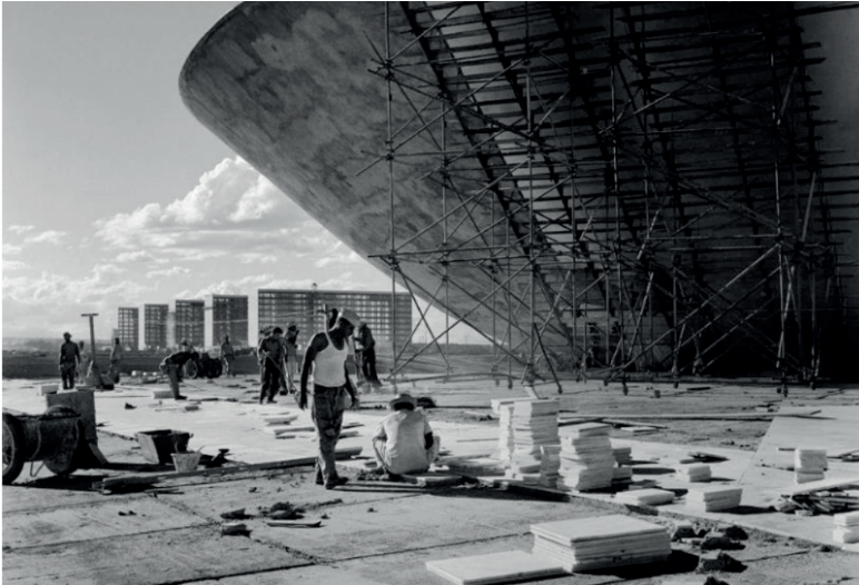
Figura 1. Trabalhadores na construção da Câmara dos Deputados do Congresso Nacional