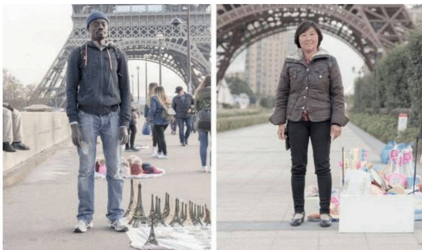
Figura 5. Paris francesa versus Paris Oriental chinesa

No Delta do Rio Yangtze, uma réplica de 108 metros da Torre Eiffel enfeita a Praça dos Campos Elísios no que foi denominado “Paris Oriental”, uma reconstrução fiel da Cidade Luz de Georges-Eugène Haussmann. As autoridades de Xangai desenvolveram um plano para “Uma cidade, nove vilas” que previa cercar a metrópole com dez comunidades satélites, cada uma abrigando até 300 mil e cada uma construída como uma réplica em escala real de uma cidade estrangeira (BOSKER, 2013). (Tradução do autor)