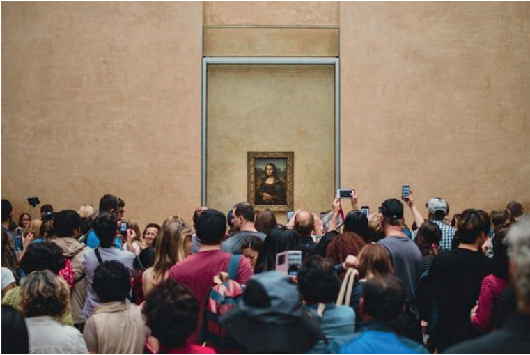
Figura 2. Aglomeração de pessoas na sala de exposição da Mona Lisa no Louvre