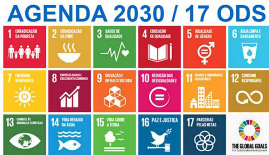
Figura 1 – Objetivos globais para o Desenvolvimento Sustentável

Espera-se que com os resultados desta pesquisa, além de gerar conhecimento e informação sobre a temática envolvida, consiga-se analisar e avaliar a melhor metodologia para auxiliar as comunidades em vulnerabilidade social com uma fonte de energia renovável de baixo custo, causando menores impactos ambientais e grandes benefícios sociais. Além disso, este projeto está alinhado a três dos dezessete Objetivos do Desenvolvimento Sustentável proposto pela ONU (Figura 1), o objetivo 7 que visa assegurar o acesso confiável, sustentável, moderno e a preço acessível à energia para todos; o objetivo 12, assegurando padrões de produção e de consumo sustentáveis e o objetivo 13, adquirindo medidas urgentes para combater a mudança climática e seus impactos.