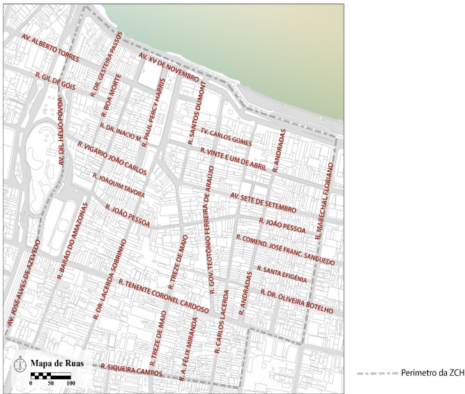
Figura 02: Mapa de ruas da área pertencente à Zona do Centro Histórico (ZCH), estabelecida pelo Plano Diretor