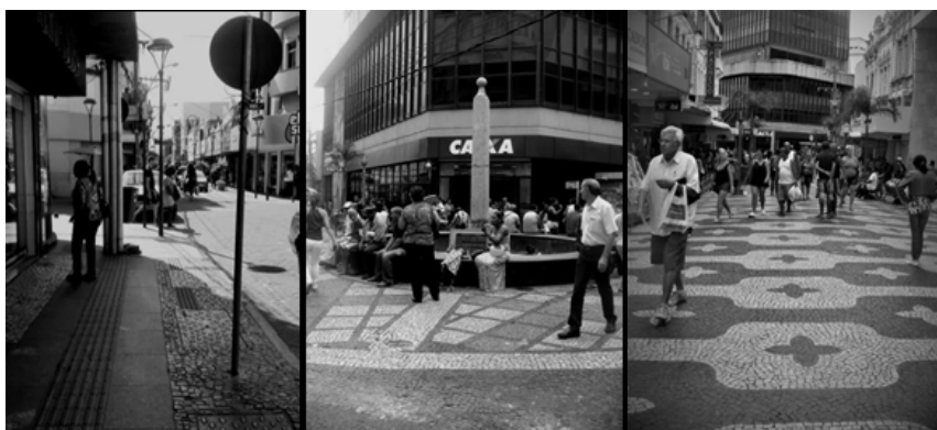
Figura 01: O centro histórico de Campos dos Goytacazes-RJ

As experiências de caminhadas serão observadas e analisadas na área central de Campos dos Goytacazes (Figuras 01 e 02). Por se tratar do núcleo original e histórico da cidade (FREITAS, 2006), a área do centro histórico da cidade, além de desempenhar um papel relevante na história e desenvolvimento do município, apresenta características e ambientes favoráveis ao deslocamento a pé e à exploração da cidade, como por exemplo, ruas estreitas, curtas distâncias a pé e um conjunto arquitetônico rico em detalhes (GEHL, 2013).