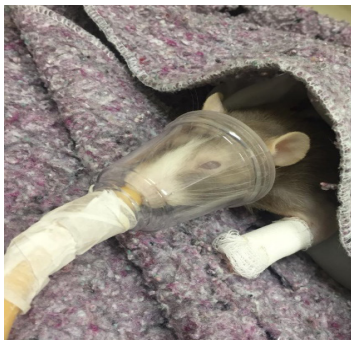
Figura 6 - Acompanhamento Após o Procedimento Cirúrgico seguiu sendo acompanhado com oxigenioterapia e colchão térmico e com monitoramento dos parâmetros vitais.