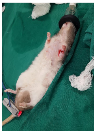
Figura 5 - Pós-Operatório Imediato Paciente já com exérese da neoplasia após a imediato pos a cirurgia.