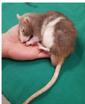
Figura 1 - Membro Torácico Esquerdo com aumento de volume ulcerado na região caudal distal ao cotovelo.

membro torácico esquerdo) e alopecia pelo corpo. A suspeita inicial foi de neoplasia, sendo solicitados exames complementares para diagnóstico.