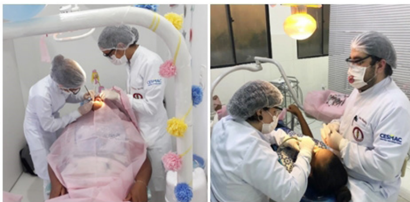
Figura 4: atendimentos realizados por extensionistas na Associação Espírita Nosso Lar.

Além disso, criou-se um memento farmacológico, apresentando as categorias de cada medicamento e o mais indicado para o público alvo da extensão e a sua respectiva necessidade, facilitando no momento da prescrição de algum medicamento. Foram atendidas gestantes de todos os trimestres durante a extensão.