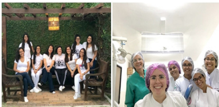
Figura 3: Grupo de extensionistas no planejamento dos atendimentos às gestantes.

As extensionistas participaram de encontros semanais na comunidade espírita Nosso Lar, localizada em um bairro próximo ao centro acadêmico, o qual atende uma grande demanda das gestantes que residem nas redondezas. Nesse local, dispomos de um consultório odontológico equipado, com instrumentais e equipamentos de proteção individual para todos os atendimentos, além de uma grande área para a realização de ações e palestras (Figura 4).