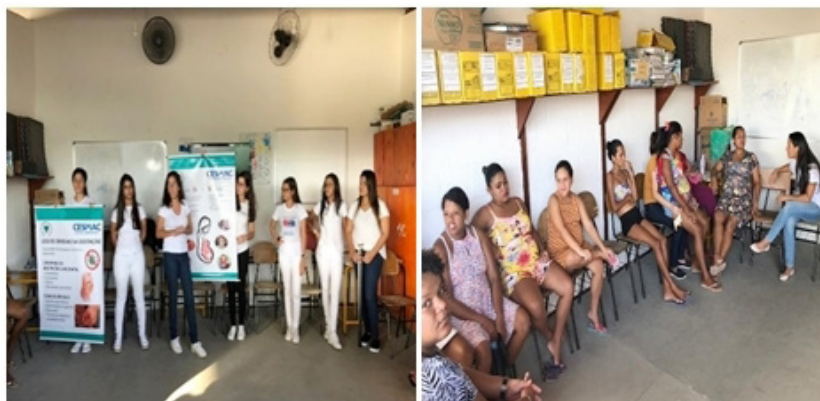
Figura 1: Palestra abordando temas básicos a respeito das atitudes que influenciam na gestação.