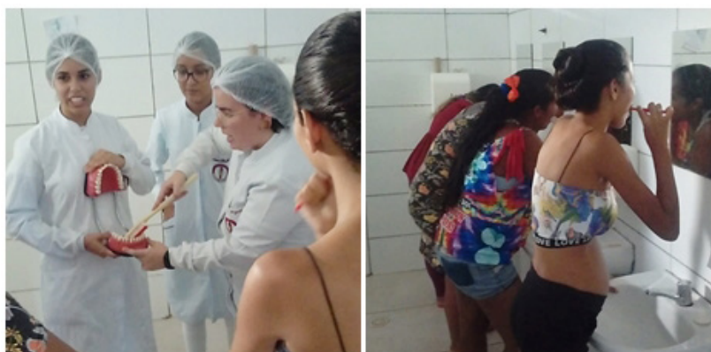
Figura 2: Instrução e supervisão de higiene oral.