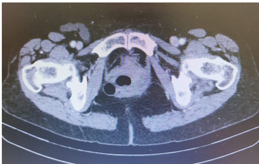
Figura 2: Tomografia de abdome corte em região inguinal

Tomografia de abdome com distensão líquida de delgado, nível hidroaéreo e com zona de transição em segmento ileal na topografia da fossa ilíaca direita, colon redundante com ceco na topografia do hipogastro a esquerda.