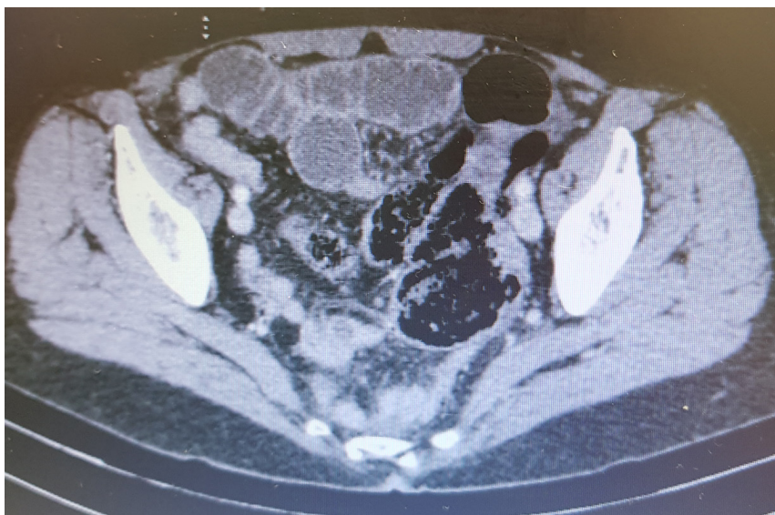
Figura 1: Tomografia de abdome com distensão delgado

Paciente, 66 anos, feminino, com antecedentes de Miastenia Gravis, DPOC, osteoartrose, ex-tabagista, sem cirurgias prévias. Procurou atendimento de urgência com dor abdominal em FID, vômitos biliosos, parada da eliminação de flatos e fezes há 2 dias. Exame físico em regular estado geral, abdome distendido, doloroso à palpação, descompressão brusca ausente, abaulamento inguinal à direita doloroso.