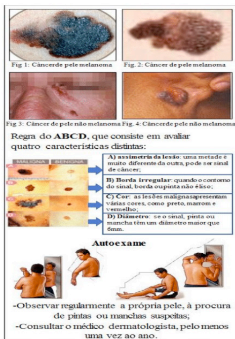
Figura 7. Recorte do folder “Combate ao câncer de pele” destacando aspectos da linguagem aplicada ao público-alvo

A linguagem utilizada no folder está adequada às séries em questão, com algumas adaptações de termos específicos do tema para deixá-la clara e direta, afim de que permita uma maior interação entre o aluno e o professor (Figura 10). Neste item, a análise converge com a proposta de Mercado e Freitas (2013) ao destacarem uma Linguagem dialógica proposta nos materiais didáticos na qual se propõe uma participação ativa do aluno, estimulando-o a participar de um diálogo: interrogar, escutar, responder, concordar, questionar, divergir e propor pausas reflexivas.