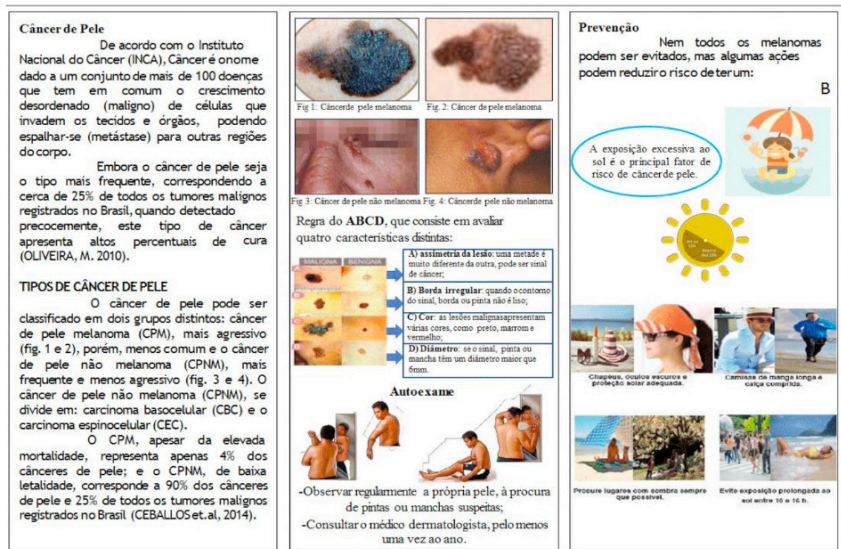
Figura 4. Material didático - folder informativo (frente (A); verso (B)).