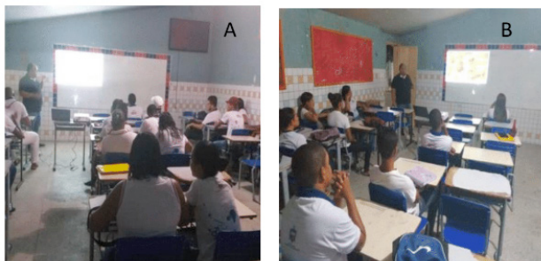
Figura 3. Ação de educação e saúde contra o câncer de pele, com estudantes da 1ª (A) e 3ª (B) séries do Ensino Médio, modalidade EJA