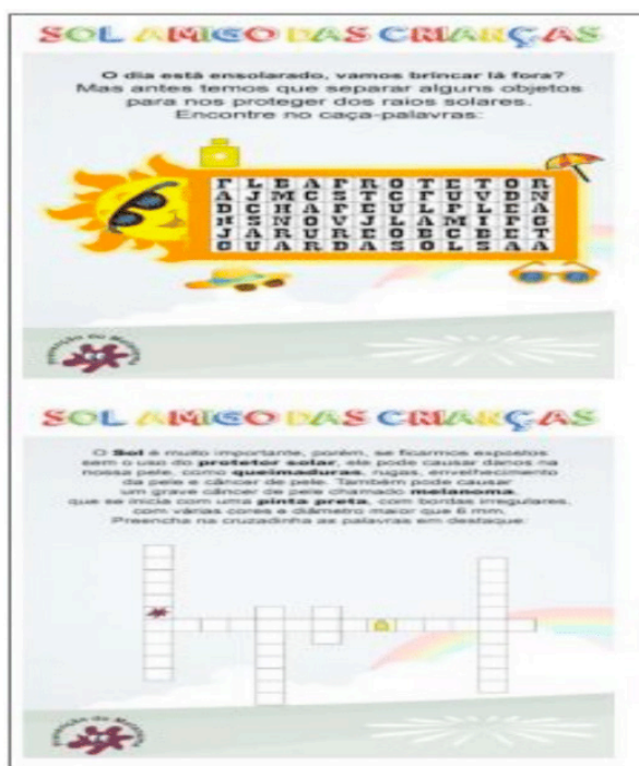
Figura 6. Recorte do folder “Combate ao câncer de pele” destacando as atividades propostas para autoavaliação.

Em relação às atividades propostas, foram trabalhadas de forma lúdica e com clareza para que facilitassem o entendimento dos estudantes, visto que o conteúdo exposto faz parte da ementa do curso, permitindo que o professor(a) utilizasse também na avaliação da aprendizagem. Foram propostas atividades lúdicas para o desenvolvimento do raciocínio (Figura 9), concretizando a metodologia ação-reflexão-ação que corrobora com a proposta de Mercado e Freitas (2013) ao destacar os questionamentos levantados nos materiais didáticos para exercitar o raciocínio crítico, a capacidade de observação e análise e o estabelecimento de relações, estimulando os mesmos a pensar uma situação-problema.