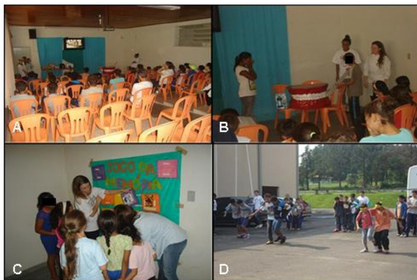
Figura 2 – Atividades educativas e lúdicas realizadas durante o evento Práticas de orientação e prevenção relacionadas à saúde bucal

A participação efetiva dos alunos nas atividades educativas de orientação e prevenção em saúde bucal, mostrou o interesse despertado e o incentivo dado ao hábito de escovação. Durante as oficinas os alunos puderam questionar e trocar experiências diretamente com os discentes que desenvolveram temas como cuidados, higiene, alimentação saudável para os dentes, cárie, tártaro e tratamento, confirmando ser esta metodologia de ensino satisfatória para aprendizagem na faixa etária aplicada. Os cuidadores dos alunos também participaram das oficinas educativas e puderam aprimorar seus conhecimentos sobre os cuidados com a saúde bucal e técnicas de escovação para a promoção da saúde, na prática diária junto aos alunos. As ações realizadas no evento estão ilustradas na Figura 2.