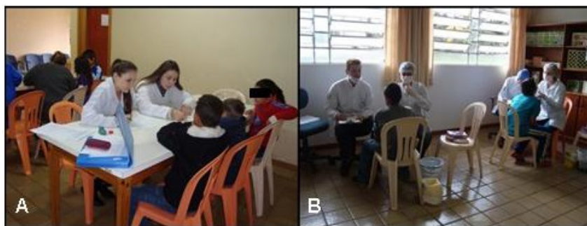
Figura 1 – Ações realizadas para os alunos do Instituto João XXIII durante o evento Práticas de orientação e prevenção relacionadas à saúde bucal

Todos os participantes preencheram o questionário sobre saúde bucal demonstrando algum conhecimento sobre o tema, que também é corriqueiramente abordado no ambiente do lar e escolar. O mesmo apontou a dificuldade do hábito de escovação após todas as refeições, de no mínimo três vezes ao dia (dados não demonstrados) - Figura 1A.