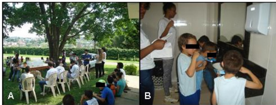
Figura 3 – Orientação da higiene bucal aos alunos do Instituto João XXIII - evento Práticas de orientação e prevenção relacionadas à saúde bucal

intermediada pelos discentes, de modo a averiguar e corrigir a escovação com alguma prática inadequada por parte dos alunos (Figura 3).