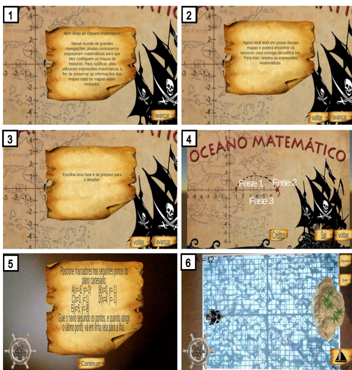
Figura 2. Explicação das regras do jogo.