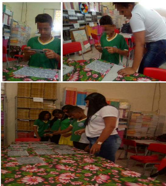
Figuras 3, 4 e 5. Aplicação do jogo “Oceano Matemático”.

Ao aplicar o jogo a prioridade seria estimular os alunos que já houvessem realizado contato com o plano cartesiano. No entanto, no decorrer da amostra os alunos dos demais anos solicitaram com que fosse ensinado o plano cartesiano para que eles também pudessem participar. Assim, felizmente houve uma grande adesão dos alunos de todas as turmas presentes no momento da amostra. E todos ficaram dedicados em aprender para poder seguir corretamente as coordenadas e chegar à ilha (Figuras 3, 4 e 5).