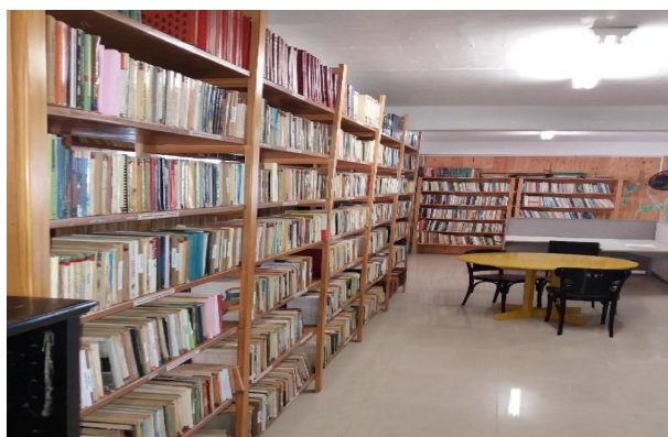
Figura 6 – Biblioteca Pública Municipal Dr. Werneldo Hörbe

E por fim a Biblioteca Pública Municipal Dr. Werneldo Hörbe (Figura 6) situada junto com o museu este acervo possui cerca de 15.500 livros que retratam diversos temas e história do Rio Grande do Sul e município. E é um importante ponto de encontro cultural principalmente pelas escolas locais do município.