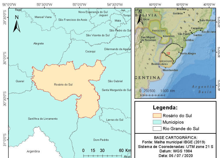
Figura 1 – Mapa de Localização do Município de Rosário do Sul.