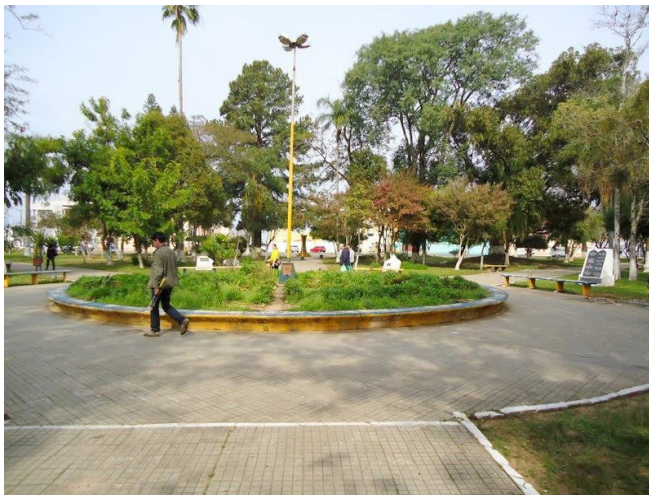
Figura 5 – Praça Borges de Medeiros