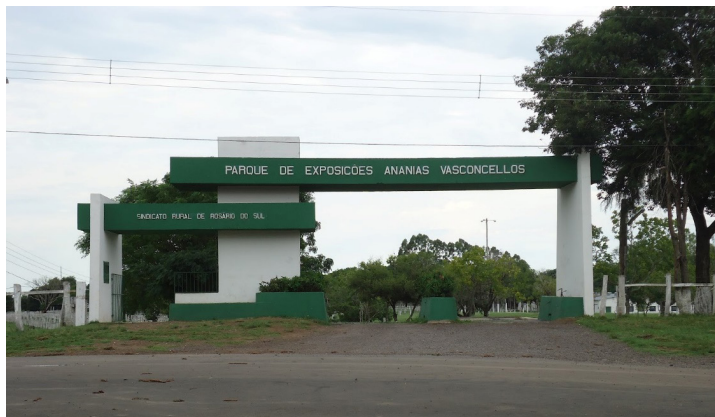
Figura 4 – Parque de Exposições Ananias Vasconcellos