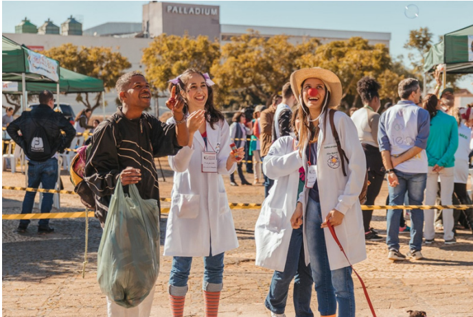
Figura 1- Participantes do Projeto de Extensão Palhaçoterapia

Legenda: Na foto acima, encontra-se participantes do projeto juntamente com um morador em situação de rua observando bolhas de sabão se perdendo pelo ar na 1ª edição do evento – Ponta Grossa/PR edição 2019.