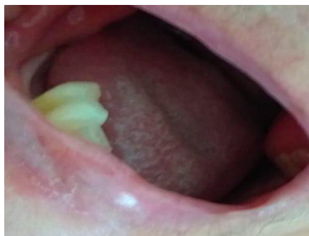
Figura 2: Lesão em dorso da língua com placa leucoplásica.

Foi encaminhada ao estomatologista, o qual levantou as hipóteses diagnósticas de CEC, estomatite aftosa e monilíase oral e, posteriormente, foi realizada biópsia incisional de tumor com margem profunda. O resultado anatomopatológico foi de carcinoma de células escamosas de língua moderadamente diferenciado (Figura 3), estendendo-se até o músculo esquelético, sendo a neoplasia classificada como