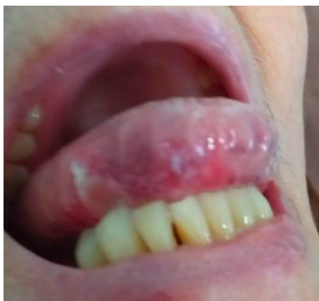
Figura 1: Lesão de borda lateral direita da língua com placa leucoplásica de consistência endurecida.

higienização satisfatória. Do ponto de vista funcional, encontrava-se desgastada e bem adaptada. Hipertensa e portadora de Artrite Reumatoide, em uso de Losartana e Metotrexato, negava história de tabagismo e etilismo. Em relação à história familiar, constatou-se mãe falecida por câncer colorretal. Estava em uso de Benzidamina spray, Nistatina suspensão oral, Lidocaína pomada e Triancinolona acetona. Foi submetida à Endoscopia Digestiva Alta, na qual verificou-se hérnia de hiato e pangastrite com teste de urease negativo.