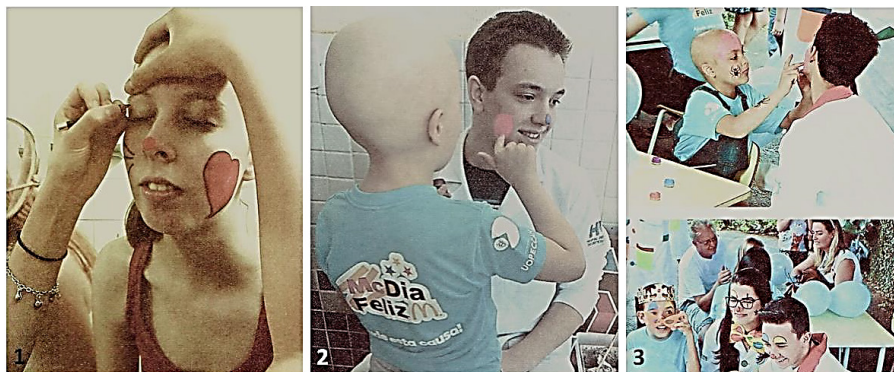
Figuras 1 – 3: Atividades do Projeto Terapia do Sorriso. 1: Caracterização como doutor-palhaço, antecedendo início das atividades com pacientes. 2 e 3 – participação dos integrantes do Terapia do Sorriso no Mc Dia Feliz em 2016.

Atualmente, o projeto conta com a participação de 30 discentes do curso de Medicina da Unioeste - Campus Cascavel, os quais estão organizados em grupos A e B. Os grupos alternam-se em visitas quinzenais, de maneira que semanalmente são realizadas as atividades do projeto desenvolvidas no Hospital Universitário do Oeste do Paraná (HUOP) e no Hospital de Câncer de Cascavel (UOPECCAN). Os participantes interagem com os pacientes de diversas maneiras, de acordo com o estado do paciente e suas solicitações. Os extensionistas atuam fazendo dinâmicas divertidas, cantando, contando histórias, brincando ou simplesmente ouvindo. Também os participantes são convidados a participar de eventos em instituições como a APAE.