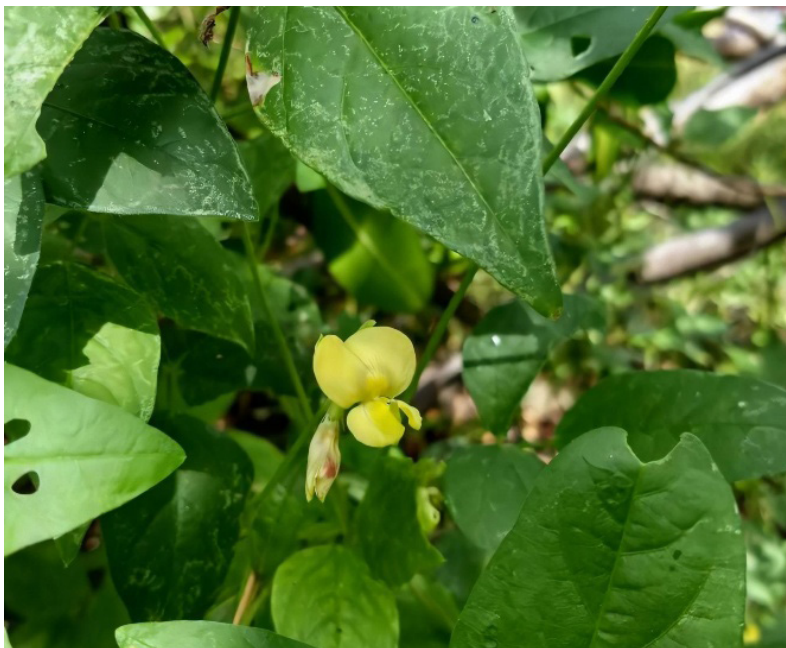
Figura 1: Inflorescência da Vigna luteola

próximo ao litoral, possui alta capacidade de fixação de nitrogênio, e potencial forrageiro (SKERMAN et al, 1991). Segundo Brasil (2011) esta é uma espécie muito palatável, sendo preferencialmente pastejada, e também uma planta que adapta-se diversos tipos de solos, como solos ácidos, fortemente alcalinos, de pouca drenagem e até solos salinos. Neste trabalho buscou-se analisar as taxas de crescimento absoluto e relativo da massa úmida de mudas de Vigna luteola (figura 1), sob o efeito de diferentes concentrações salinas.