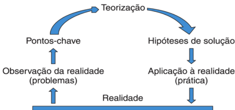
Figura 1- Representação do Arco de Magueréz.

O arco de Magueréz consta de cinco etapas, que acontecem a partir da realidade social, sendo estas: observação da realidade , definição dos pontos-chave , teorização baseada em pesquisas em diversos meios, elaboração das hipóteses de soluções e, por fim, a aplicação à realidade , onde os indivíduos, após a observação do caso, são levados a construir novos conhecimentos para transformar a realidade observada, por meio de suas hipóteses anteriormente planejadas. (BERBEL, 1998; PRADO et al., 2012). (Figura 1)