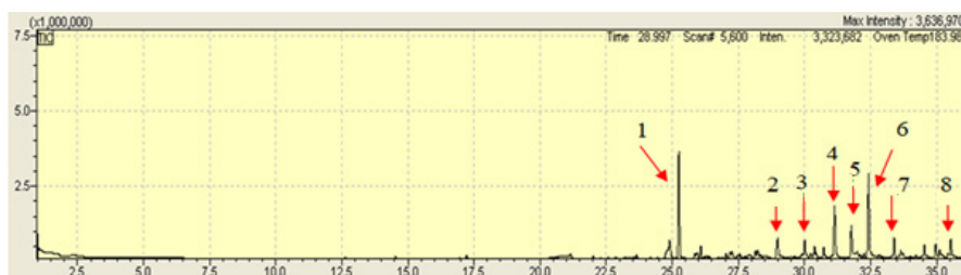
Figure 2: Chromatogram containing the peaks of the chemical compounds isolated through the headspace method

volatile compounds contained in the sample with the objective to isolate the volatile substances existent in the sample. The following figure represents the chromatogram related to analysis: